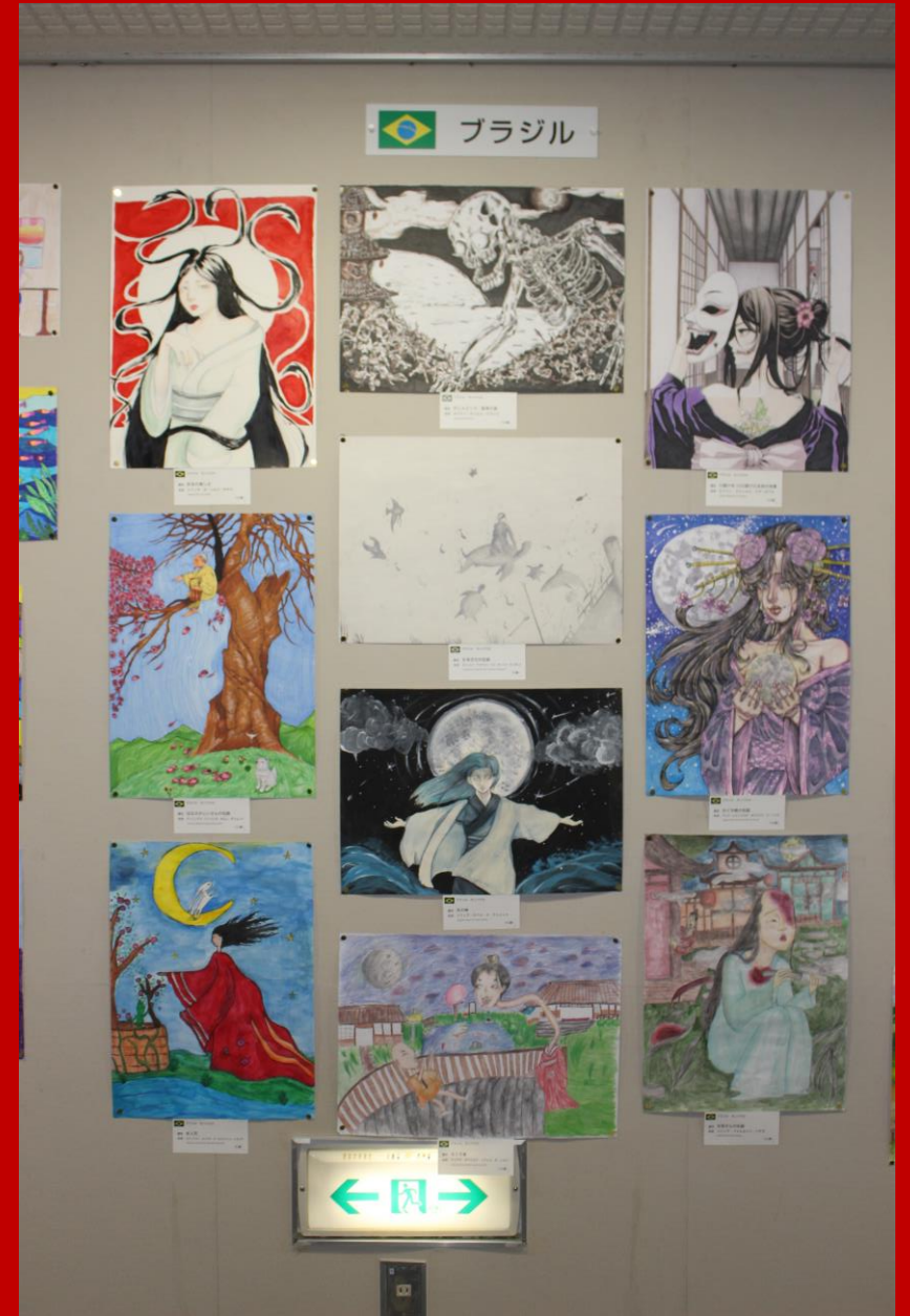
Festival de Arte e Cultura ocorreu durante o período de 3 dias, do dia 14 a 16 de setembro de 2024 na Província de Toyama / Japão